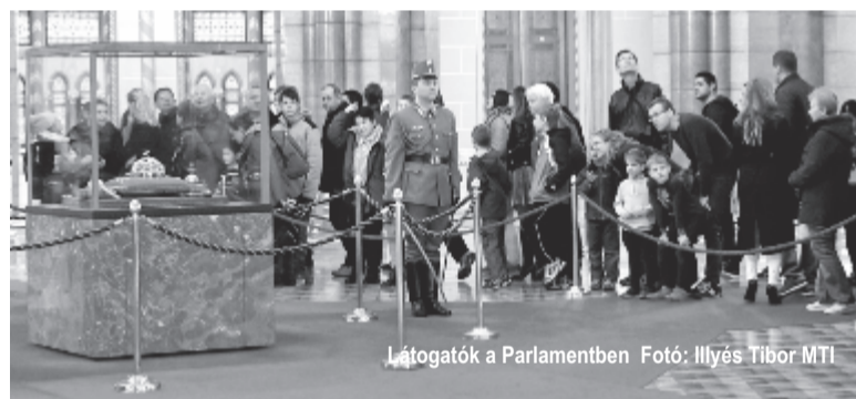
Látogatók a Parlamentben.

megben magyar, lengyel és székely zászlókat lengettek. A Fidelitas tagjai „Soros fizet, Juhász fütyül” feliratú táblákat tartottak a magasba a Múzeum körút Kálvin tér felőli oldalán. Az Együtt korábban az Astoriánál és a Kálvin téren sípokat osztott. Orbán Viktor beszéde alatt ellenzéki tüntetők végig fütyültek, sípoltak, kereplőkkel tiltakoztak, kiabáltak. Az ünnepség idején lökdösődés alakult ki a kormánypárti ünneplők és ellenzéki tüntetők kö-