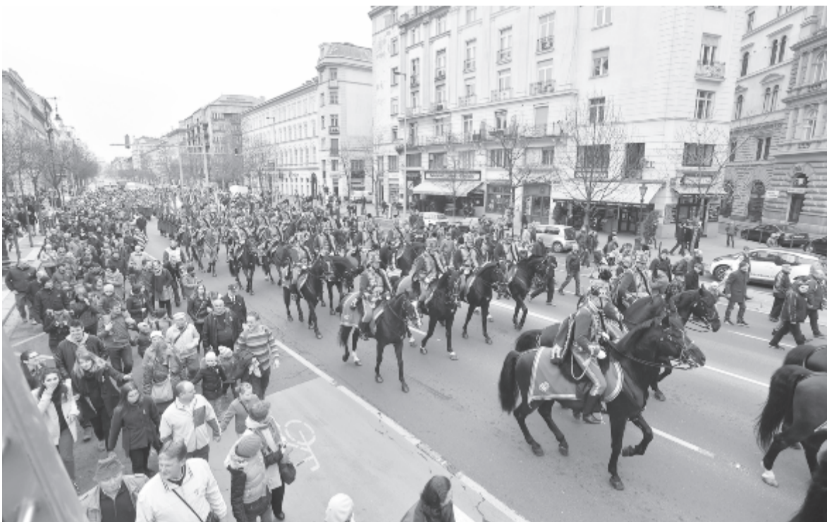
Díszmenet a Bajcsy-Zsilinszky úton a Múzeumkerthez.

Március 15. a cáfolhatatlan bizonyíték, hogy mi voltunk, vagyunk és leszünk, „ez a mi diadalunk” – mondta Orbán Viktor miniszterelnök szerdán Budapesten, a Magyar Nemzeti Múzeumnál rendezett március 15-i díszünnepségen. „Mi itt, a Kárpát-medencében, kultúránk, birodalmak, civilizációk ütközőzónájában a lehető legnagyobb diadalállal büszkélkedhetünk. A háborút, a haza megmaradásáért és a nemzet fennmaradásáért vívott háborút végül mindig megnyertük” – fogalmazott a kormányfő. A miniszterelnök kijelentette, Brüsszelt meg kell állítani, és a kormányzati felelősséget továbbra is a nemzeti erők kezé-