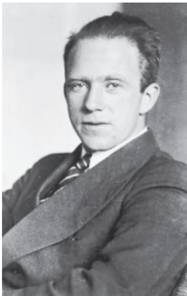
Werner Karl Heisenberg (1901–1976)

Mikor kezdődjön a gyermek zenei nevelése? Kodály Zoltán már az anya születése előtti időszakhoz köti a gyermek zenei nevelését. Valahogy így történt ez Heisenberg életében is, mert családi hagyományként már a szülei is muzsikáltak. Édesanyja híres történész, apja a görög nyelv professzora volt. A gyerek pedig már négyévesen zenei oktatásban részesült – akár társcsillaga, Max Born. A közös családi muzsikálások életre szóló utraवलóként szolgáltak.