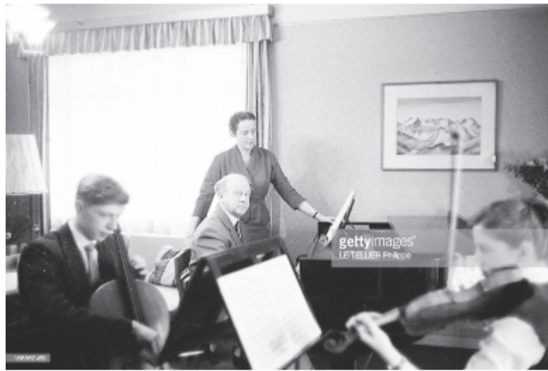
Heisenberg zenélés közben (Göttingen, 1958. márc. 5.)

Heisenberg híres volt analitikus gondolkodásmódjáról. Talán ezért is fedezhette fel a zenei szépség mellett a muzsika rejtett észszerűségét. És ekkor kibontakozott előtte egy újabb univerzum, a zenei struktúra világa. Rájött, hogy a zenei szerkezet mennyire szoros kapcsolatban áll a matematika törvényeivel. A szimmetria, az egyensúly, az ok-okozat mind ott bujkálnak a harmóniákban, a szólamozgásokban, az imitációkban, a díszítésekben, a diszsonanciákban és azok feloldásában. E különös felfedezésekben viszont csak a kiváltságosak részesülhetnek, azok, akik kellő részletességgel megismerik a zene világát. Aki pedig nem is hajlandó a zene tanulmányozására, annak csak részleges szépséggel szolgál a hangzó világ.