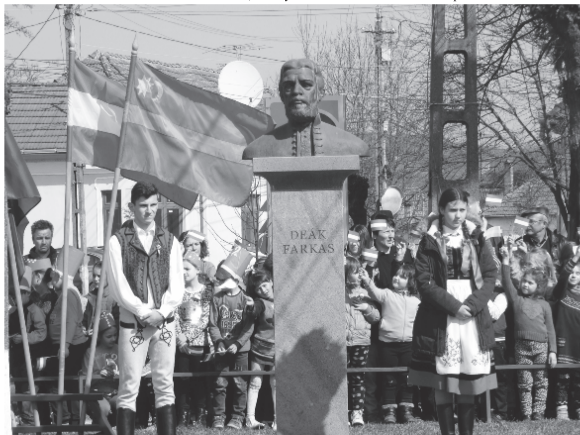
Emlékezett, fejet hajtott a magyar vidék, de mának szóló üzenete is van az ünnepnek. Nyárádszeredában is a mai veszélyekre figyelmeztettek, a helytállásra intettek.